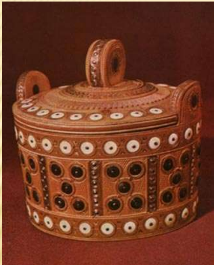
РОБОТА М. ШКРІБЛЯКА

Головні орнаментальні мотиви в тарілках і раквах він почав викладати багатокольоровим бісером.