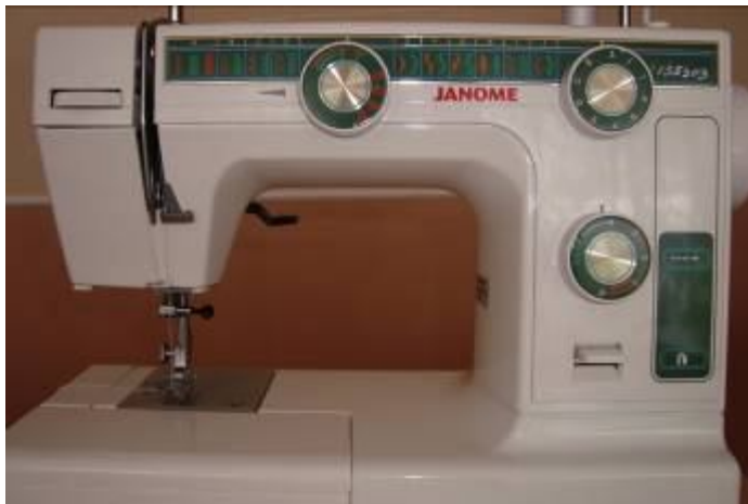
Машинка для зшивання деталей