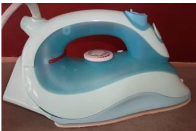
Праска для запрасування деталей