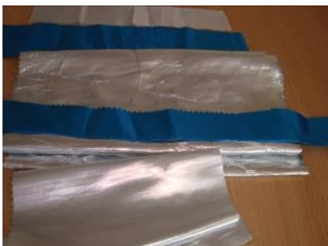
Тканина срібного та блакитного кольорів