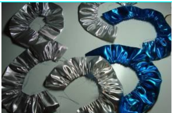
Збираємо оборки і ось що ми отримуємо.