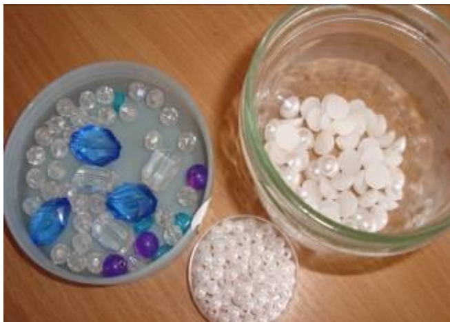
Бісер для оздоблення косметички