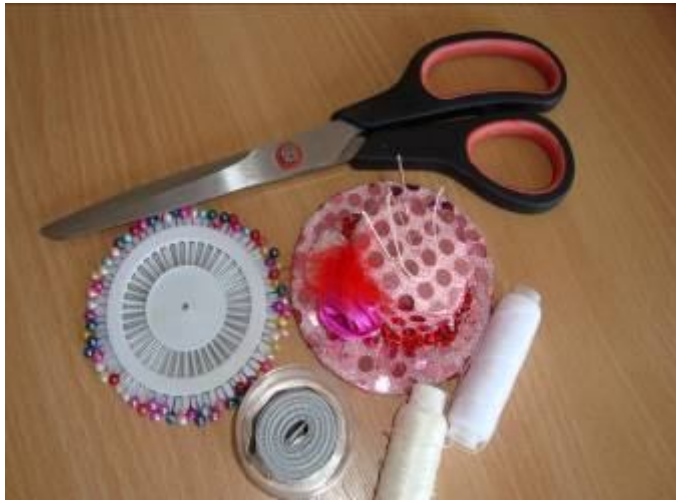
Ножиці, голки, нитки та сантиметрова стрічка