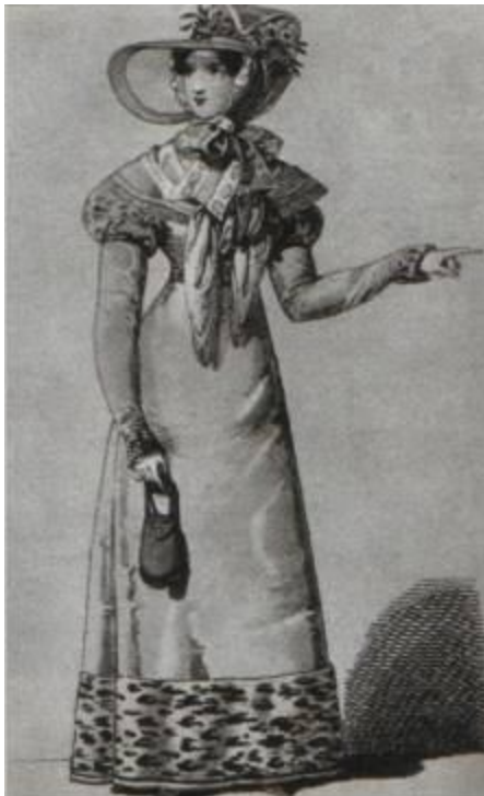
Овальная косметичка в стиле анпир. Wiener Moden, 1821

В середні віки гроші укладали в “кишені для добра”, яка кріпилася до поясу, а разом з нею до поясу кріпився і шкіряний мішечок для дрібних грошей. У XIV-XV ст. ці “кишеньки” носили і чоловіки, і жінки. При бургундському дворі вони були частиною придворного туалету, - їх